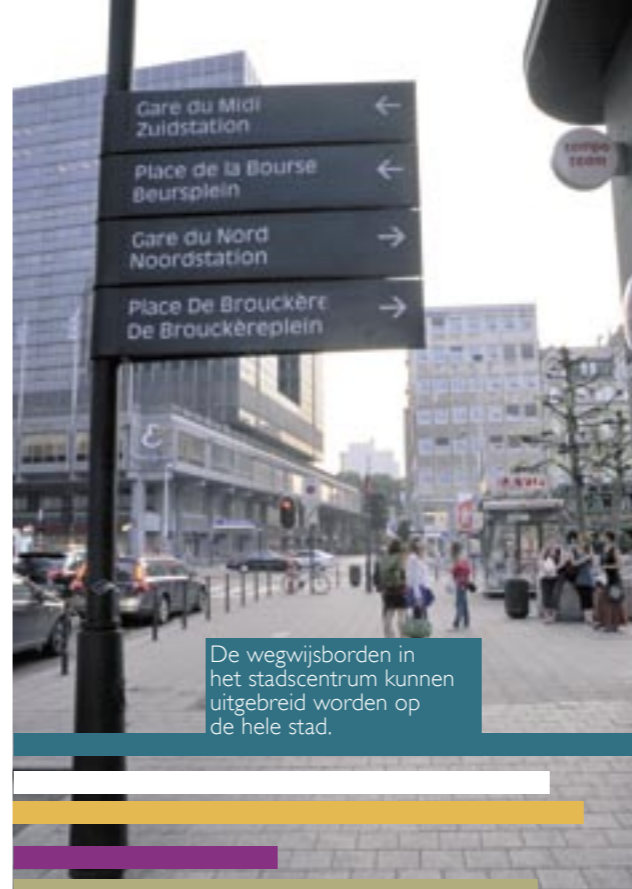
De wegwijsborden in het stadscentrum kunnen uitgebreid worden op de hele stad.

Het gevoel van toebehoren aan een buurt vermindert het onveiligheidsgevoel. Het is belangrijk dit gevoel aan te moedigen door de bewoners/bewoonsters er toe aan te zetten de voorgevels van hun woningen te renoveren of door buurtcomités op te richten voor de verfraaiing van de straten. Kleine handelszaken versterken het "buurtgevoel". Om dat eenheidsgevoel van de buurt te bevorderen is het beter constructies of vervoersassen die een barrière opzetten te vermijden. Een muurtekening van de hand van één of meerdere buurtbewoners/bewoonsters wordt blijkbaar meer gerespecteerd dan anonieme verfraaiingen en het zorgt ervoor dat de stad vrolijker en aangenamer wordt.