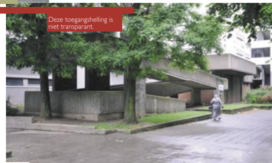
Deze toegangshelling is niet transparant.