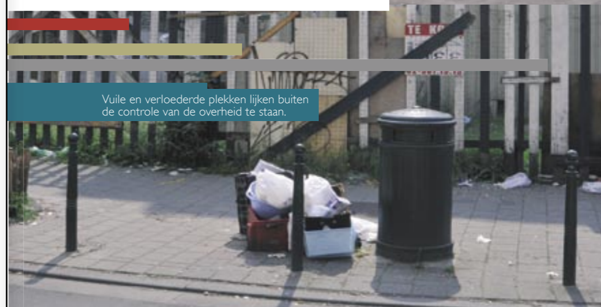
Vuile en verloederde plekken lijken buiten de controle van de overheid te staan.